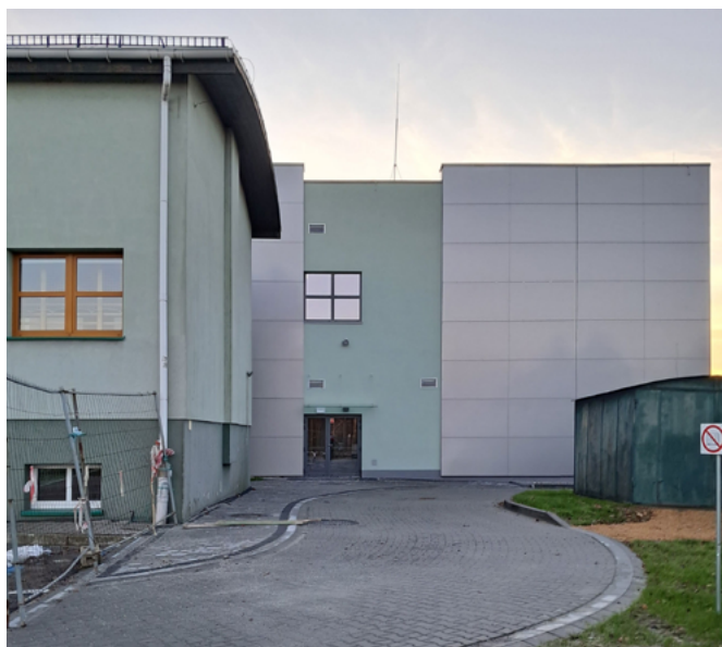
Sala w Janowicach – widok z zewnątrz