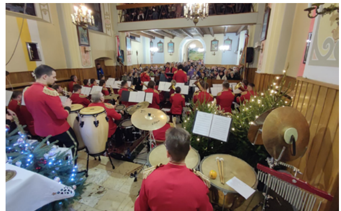
Gra Orkiestra Dęta Gminy Bestwina z siedzibą w Kaniowie