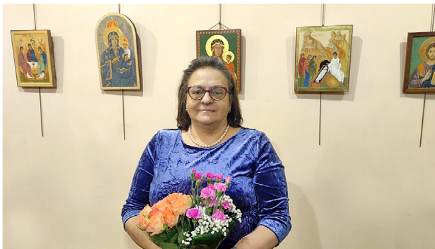
Autorka wystawy i jej ikony