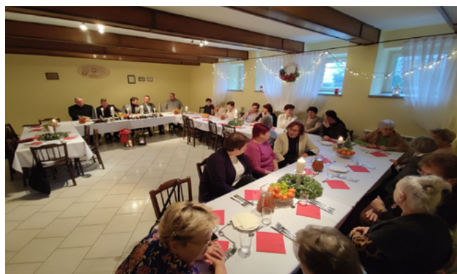
Spotkanie opłatkowe KGW Bestwiniarki