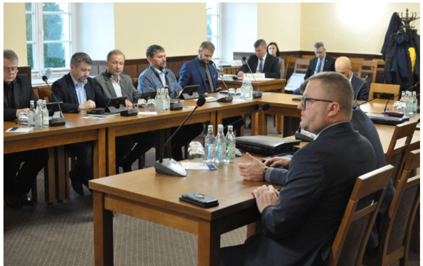
Podjęcie uchwały w sprawie budżetu