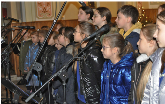
Chór „Divertimento” z ZSP Kaniów