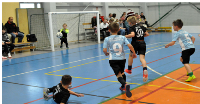
Jedno z wielu emocjonujących spotkań