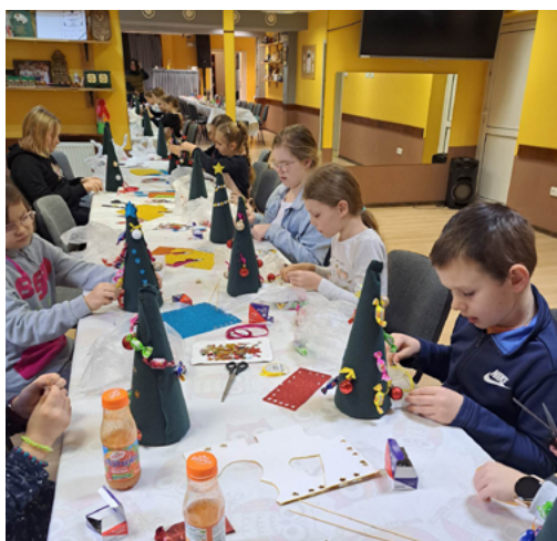
Warsztaty w Gminnym Ośrodku Kultury

Dzieci z terenu wszystkich sołectw naszej gminy wzięły udział w dniu 16 grudnia w świątecznych warsztatach plastycznych. Zajęcia odbywały się w Gminnym Ośrodku Kultury w Bestwinie, a także w świetlicy Domu Strażaka w Kaniowie. W trakcie zajęć pod kierunkiem instruktorek wykonywano rozmaite, oryginalne i pomysłowe ozdoby bożonarodzeniowe. W sumie uczestniczyło 60 młodych twórców.