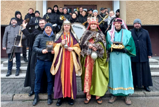
Uczestnicy orszaku w Bestwinie