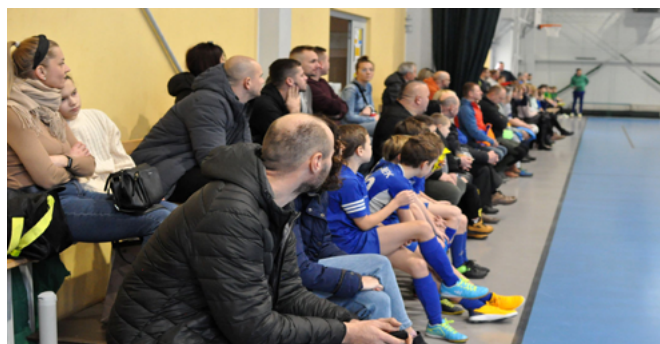
Trybuny zapelnily się kibicami