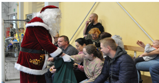
Wizyta Świętego Mikołaja