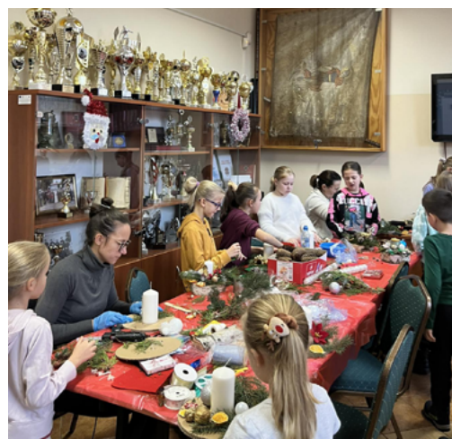
Zajęcia w Kaniowie