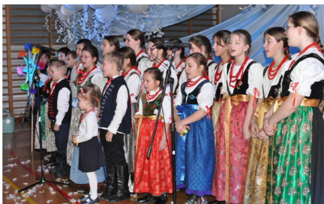
Dziecięcy Zespół Regionalny „Mała Bestwina”