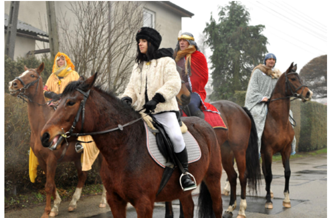
Janowice – jeźdźcy konni w rolach Trzech Króli