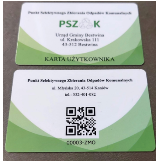
Wzór karty PSZOK

Z dniem 1 lutego 2024 r. bez okazania Karty Użytkownika odpady dostarczone na PSZOK nie będą przyjmowane.